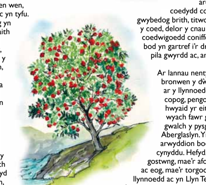
Criafolen / Rowan