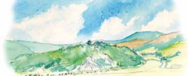
Castell y Bere

Mae'r gorffennol i'w weld ym mhobman yn Eryri. Chwe mil o flynyddoedd yn ôl gadawodd y ffermyr cynnar siambrau claddu cymunedol, neu gromlechi, a luniwyd o greigiâu enfawr. Yn ddiweddarach, yn yr Oes Efydd, arferai pobl gladdu eu meirw mewn cistiau cerrig, a'u gorchuddio gyda charneddau enfawr. Hwy hefyd a gododd y meini hirion a'r cylchoedd cerrig. Gadawodd llwythau Oes yr Haearn arfau a chelfi haearn yn ogystal â gemythau ac addurniadau o aur ac arian gyda phatrymau Celtaidd hardd. Mae anheddau'r bobl yma'n dal yn amlwg fel clystrau o gylchoedd cerrig a elwir yn gytiâu'r Gwyddelod, yn aml yng nghyffiniau ceiri ar gopaon y bryniau.