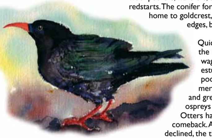
Brân goesgogoch / Chough