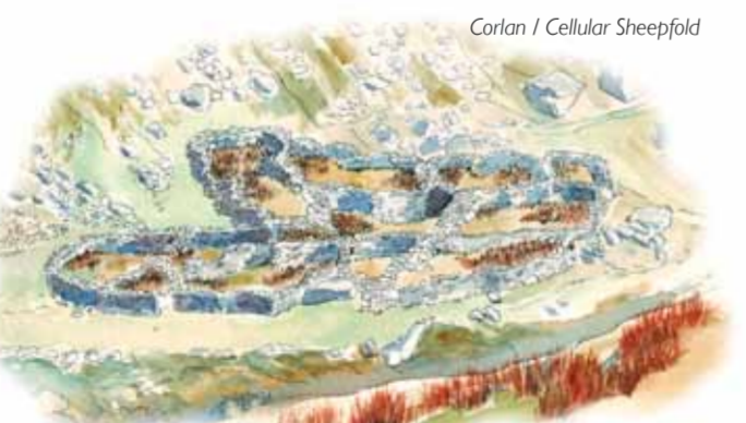
Corlan / Cellular Sheepfold

Within the National Park a distinct and remarkable cultural tradition survives. It is based on the Welsh language which is still the mother tongue of many people and is fostered in every village school. Far older than English, this ancient language provides a direct link with the past. It was the medium in which the Celtic story cycle of the Mabinogion was declaimed by bards at the courts of the Princes of Gwynedd for hundreds of years until it was written down in the 14 th century. In the 16 th century, the Bible was translated from Hebrew into Welsh by William Morgan, born at Tŷ Mawr, Wybrnant. The existence of a Welsh Bible in every household was the main reason why the Welsh language survived, despite official efforts to eradicate it.